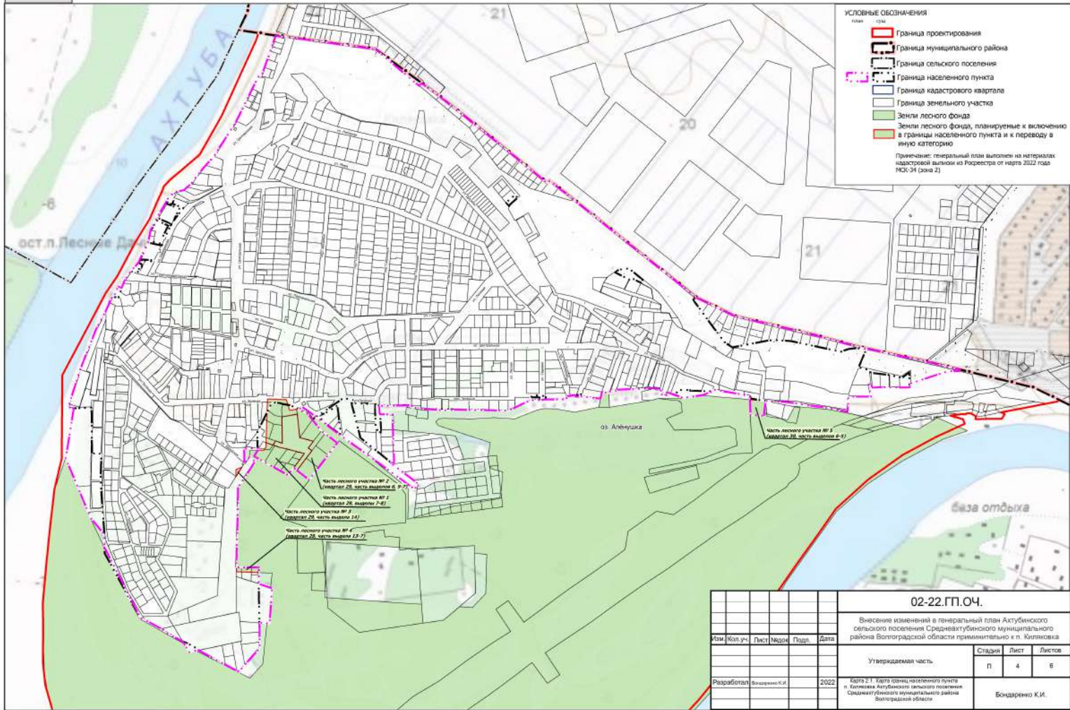
Карта 2.1. Карта границ населенного пункта п. КИЛЯКОВКА Ахтубинского сельского поселения Среднеахтубинского муниципального района Волгоградской области